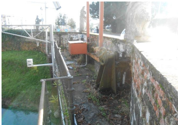
MANUFATTO IDRAULICO CENTRO STORICO ODERZO