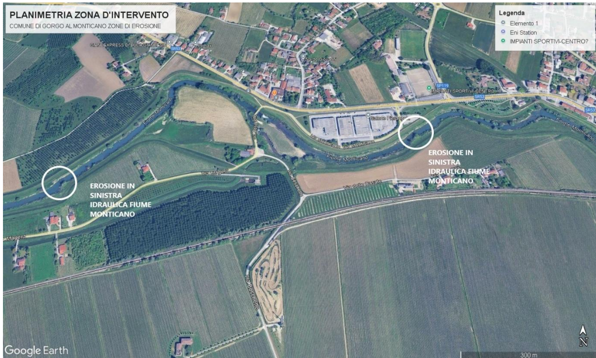
PLANIMETRIA ZONA D'INTERVENTO GORGO AL MONTICANO