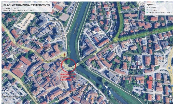
ZONA D'INTERVENTO ODERZO