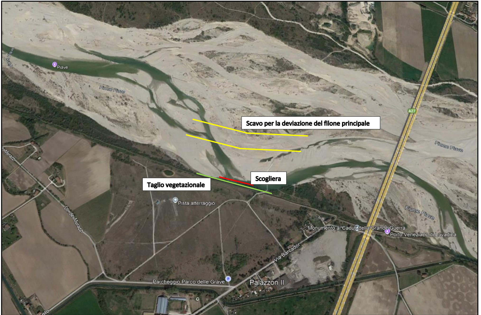
Località Lovadina – Spresiano