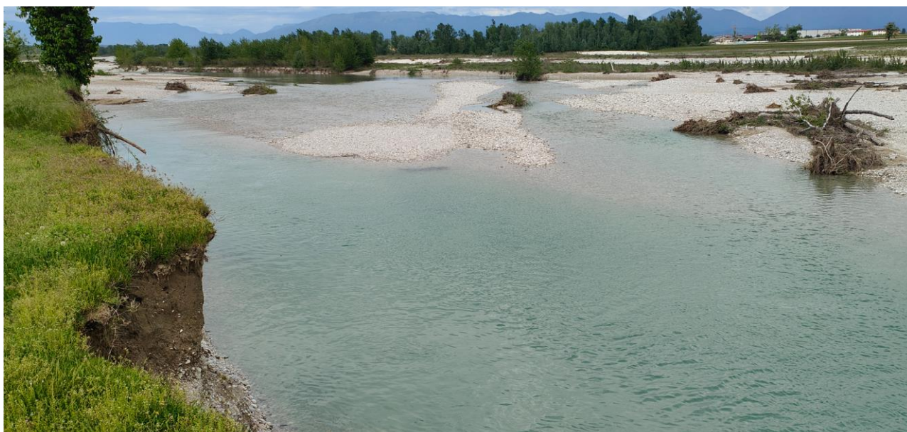
Figura 3 - Individuazione area intervento fiume Piave - Grave di Papadopoli in comune di Cimadolmo

4. L'esecuzione di tratte di scogliera salvaripa volte a limitare i fenomeni di dissesto in corso.