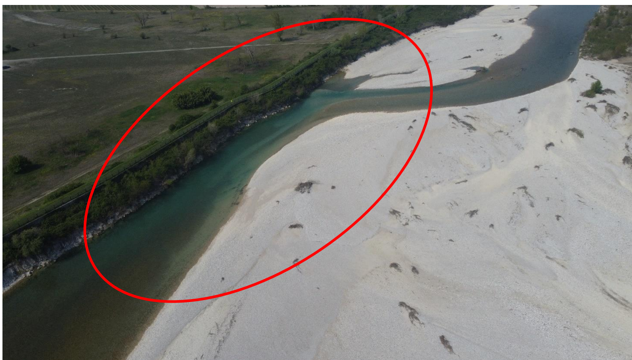
Figura 2 - Individuazione area intervento fiume Piave Lovadina di Spresiano