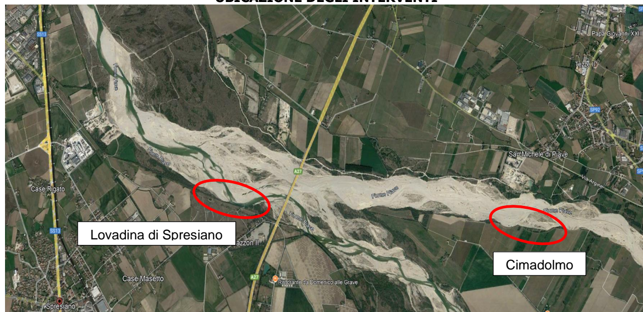
Figura 1 - Individuazione area interventi