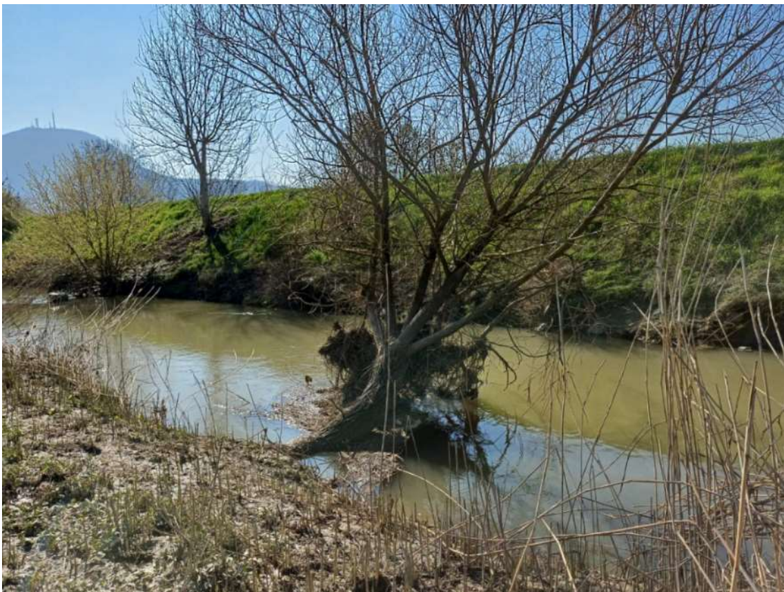
Canale Bisatto, argine sinistro in comune di Cinto Euganeo