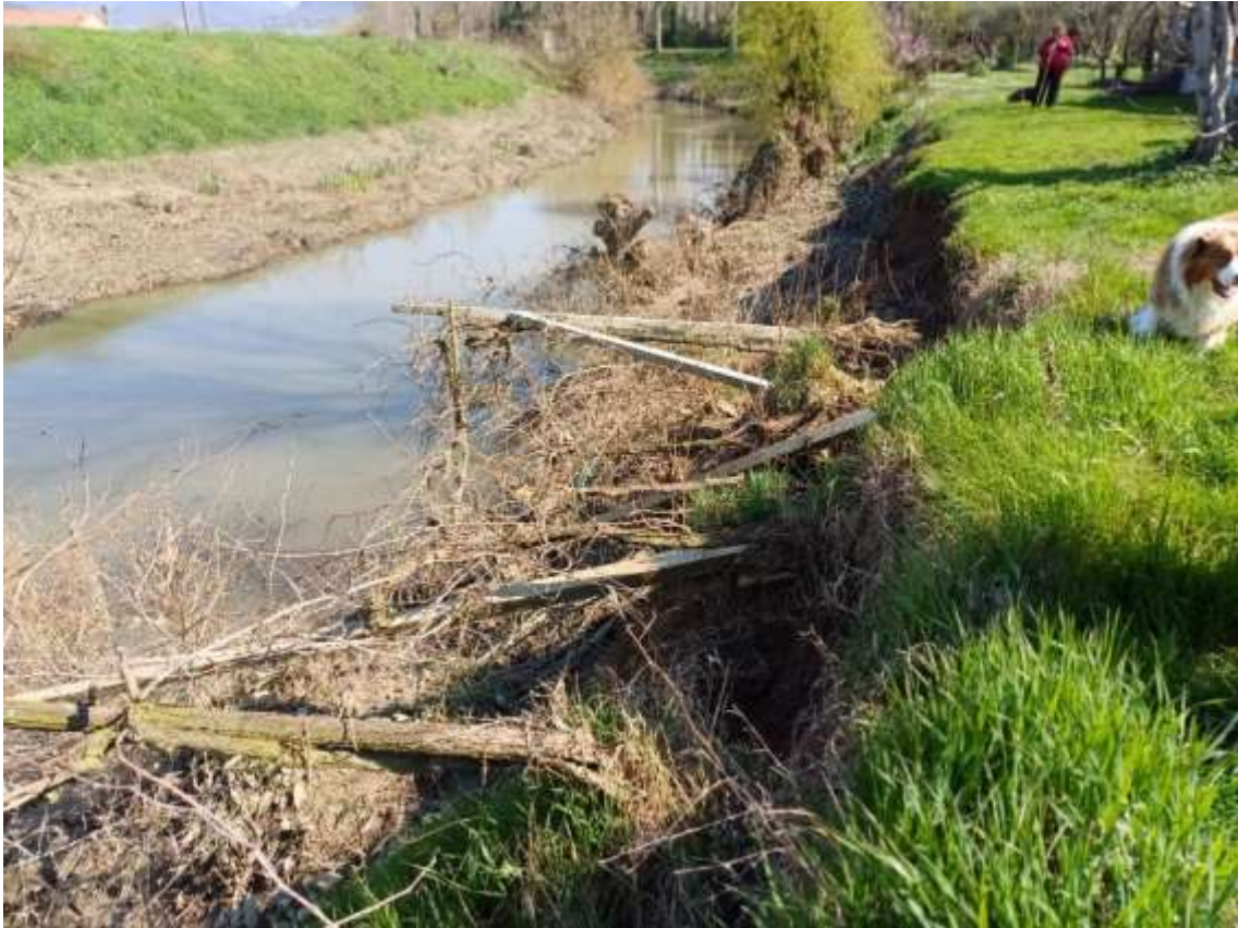
Canale Bisatto, frana in sinistra idraulica, località Rivadolmo in comune di Baone