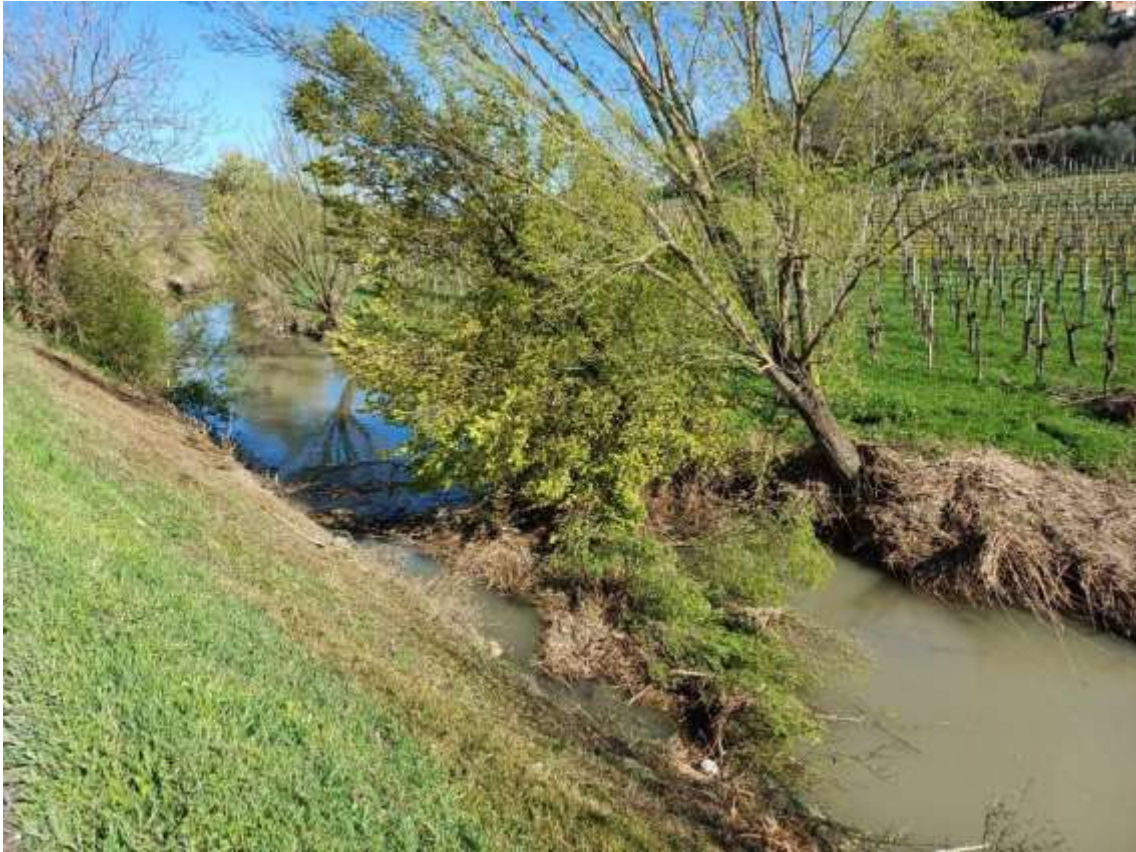
Canale Bisatto, argine sinistro in comune di Cinto Euganeo