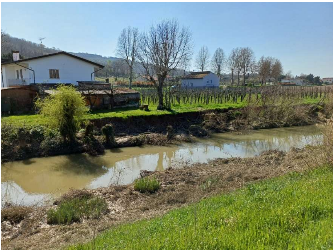
Canale Bisatto, frana in sinistra idraulica, località Rivadolmo in comune di Baone