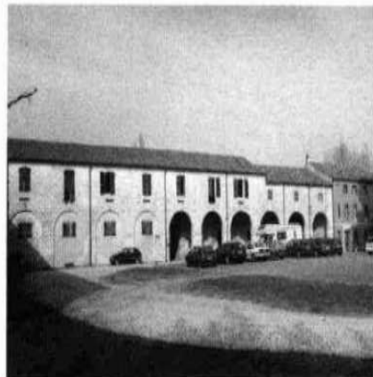
La facciata dell'oratorio (L.S. 1998)