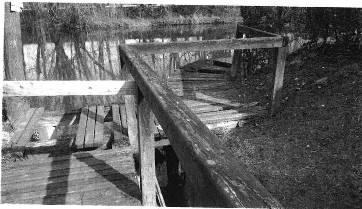
Pontile in via Scheo: Stato attuale

L'intervento è necessario e urgente per mettere in sicurezza il percorso di accesso per gli utenti ai posti barca situati a ridosso dei pontili. Si evidenzia a questo proposito che la zona è molto frequentata e non è possibile intercludere efficacemente l'accesso ai numerosi utenti che giornalmente accedono alla riva del fiume Sile. Per cui è alto il rischio di incidenti. E' necessario intervenire attraverso la sostituzione, il consolidamento e la messa in sicurezza di varie pedane, passerelle e parapetti.