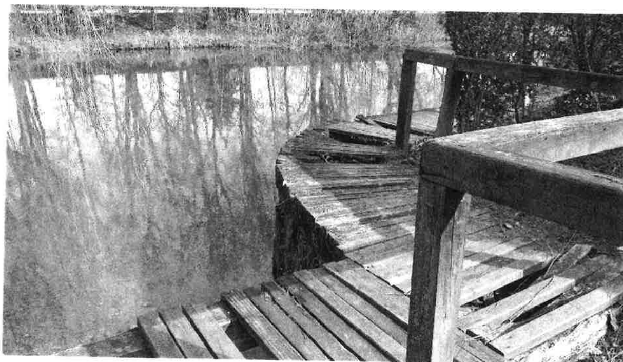
Pontile in via Scheo: Stato attuale