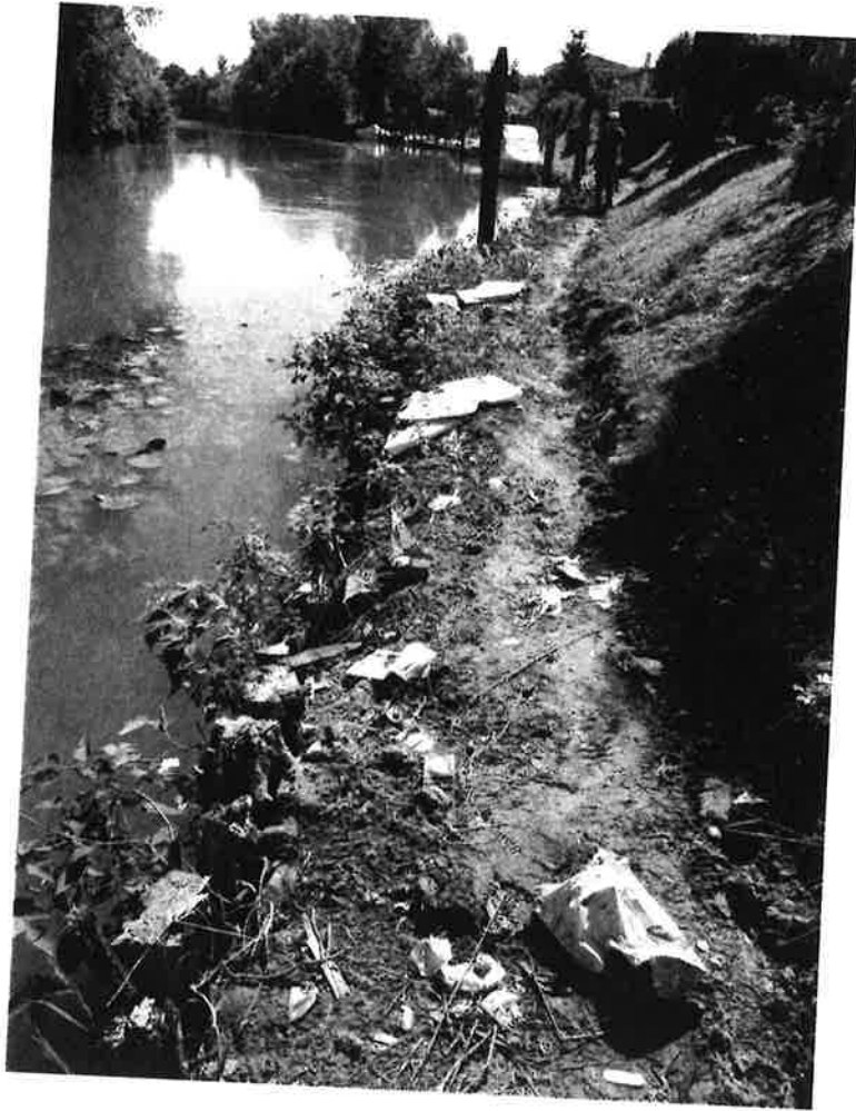
Pontile in via Scheo: Stato attuale dopo la rimozione della passerella.

In questa foto e nelle seguenti è apprezzabile la condizione di avanzato degrado della palificata di sponda che dovrebbe sorreggere la passerella attuale